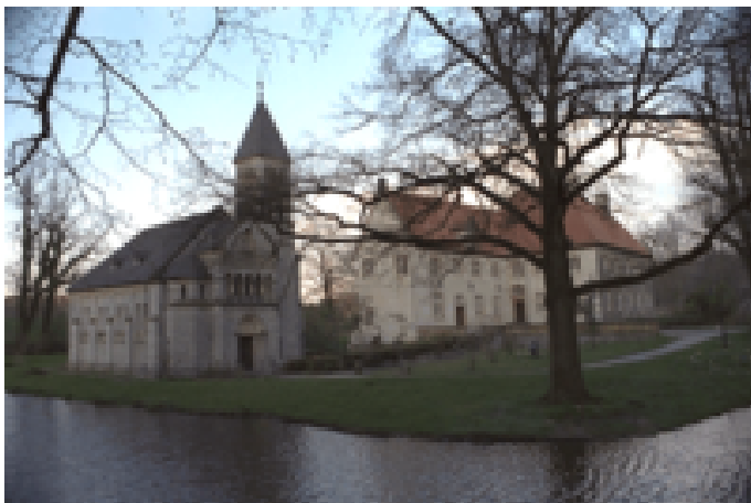
Wasserschloss Brincke Autor Tamara Kisker Quelle Fotostudio Warias