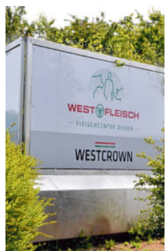
Fast jeder zweite Mitarbeiter im Fleischcenter Dissen ist jetzt in- fiziert.

Bei den Reihentests in fleischverarbeitenden Betrie- ben im Kreis sind inzwischen 6.562 Personen getestet wor- den, 6.404 Laborbefunde lie- gen vor. Davon sind 6.399 ne- gativ und fünf positiv, teilt der Kreis Gütersloh mit. Derzeit ruhen die Reihentestungen, da ein umfangreicher Datenab- gleich vorgenommen werde, sagt der Kreis. Beschäftigte, die zum Beispiel im Urlaub oder in Elternzeit sind, sollen fest- gestellt werden.